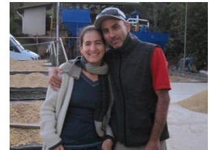
モンテス・デ・オロマイクロミル オーナーご夫婦

●コストリカ レオンコルテス モンテス・デ・オロ マイクロミル 数量限定発売!! やわらかな口当たり、柑橘の酸、ローストアーモンドやカカオの風味、黒糖のような甘みが特徴です。